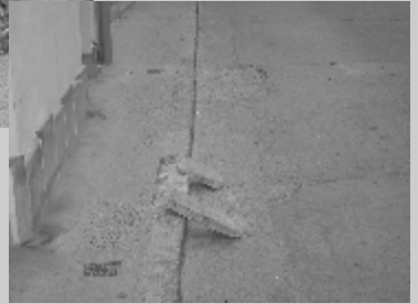
La majoria dels embornals de Tàrrrega estan embossats