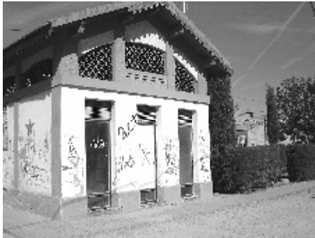
Les instal·lacions de Renfe aniran agafant el mateix aspecte que els actuals WC

Des de la Federació de Veïns de Tàrraga, creiem que la decisió d'aquest tancament ve provocada per la poca rendibilitat que en aquests moments ofereix aquesta estació, però no compartim la manera en què es pretén rendibilitzar la línia de Cervera-Barcelona, ja que des del nostre punt de vista la rendibilització passa per la millora de la línia i per optimitzar l'actual recorregut, fins enllaçar-lo amb Igualada.