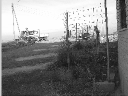
Se'n pot dir plaça Girona d'això?