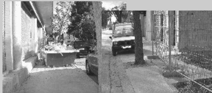
Voreres bloquejades per obres, tanques i vehicles