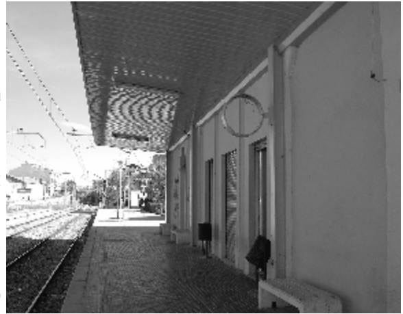
L'estació de RENFE ja no desposa ni del rellotge

Creiem que amb aquesta decisió un cop més els ciutadans de comarques reben diferent tracte al de les capitals i en lloc de potenciar les comarques interiors oferint un bon servei i unes bones comunicacions, el que s'està fent és aïllar-les cada cop més. També s'han de tenir en compte que l'automatització d'aquest servei obstaculitzarà l'accés a algunes persones, com per exemple, la gent gran i els disminuïts.