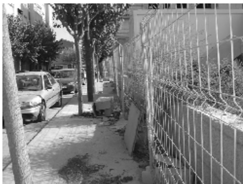
Estat d'alguns carrers de Tàrraga

També des de la FAVT fem una crida a tant als veïns com als propietaris d'establiments comercials o industrials per tal que es comportin cívicament i col·laborin a mantenir neta la nostra ciutat 3