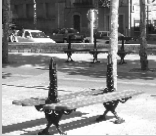
Millora del mobiliari urbà -Bancs trencats de la Pl. Anselm Clavé