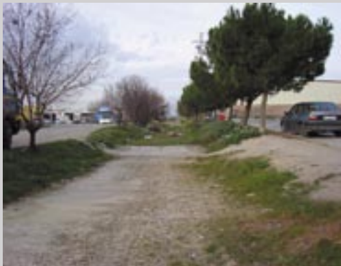
26 anys reclamant la Rbla. Canalet. Barri Sol Ixent

“Els veïns demanen bancs, papereres i millorar la il·luminació”